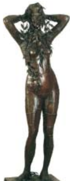
Γλυπτό "Κωπηλασία" της Αγγέλικας Κοροθέση

Γλυπτό "Βροχή των λουλουδιών" του Αριστείδη Πατσόγλου